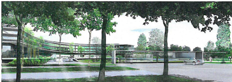
Le Centre de Recherches en Cancérologie de Toulouse (CRCT)

La Fondation Toulouse Cancer Santé et l'Institut de Recherche Pierre Fabre, acteurs majeurs du campus de l'Oncopole de Toulouse, annoncent la création conjointe d'une chaire de recherche intégrée aux équipes du Centre de Recherches en Cancérologie de Toulouse (CRCT). Cette chaire, financée pour une durée de 5 ans à part égale entre la Fondation Toulouse Cancer Santé et l'Institut de Recherche Pierre Fabre sera dédiée à la recherche en immuno-oncologie.